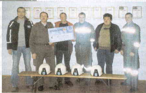
Foto rechts: Der Vorstand des MSV und das FF - Kommando bei der Übergabe.

Auch heuer wieder hat uns der MSV Großweißbach eine Geldspende überreicht. Wie erhielten wir auch auf dem Foto nebenan ersichtlich eine Spende in der Höhe von 1000.- Euro. Mit diesem Geld konnten wir die Finanzierung unserer neuen Einsatzhelme sicherstellen.